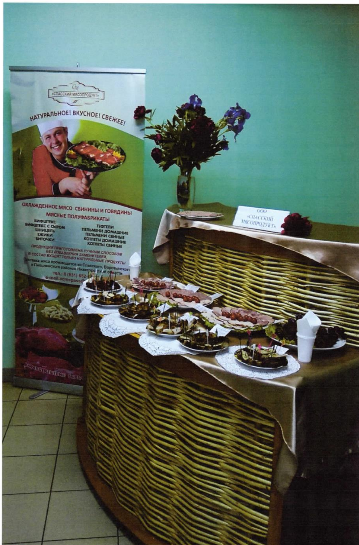
Дегустация продукции ООО «Спасский мясопродукт»