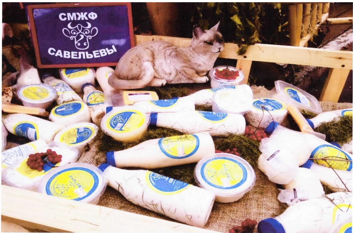
Продукция семейной молочно - животноводческой фермы «Савельевы», село Вазьянка