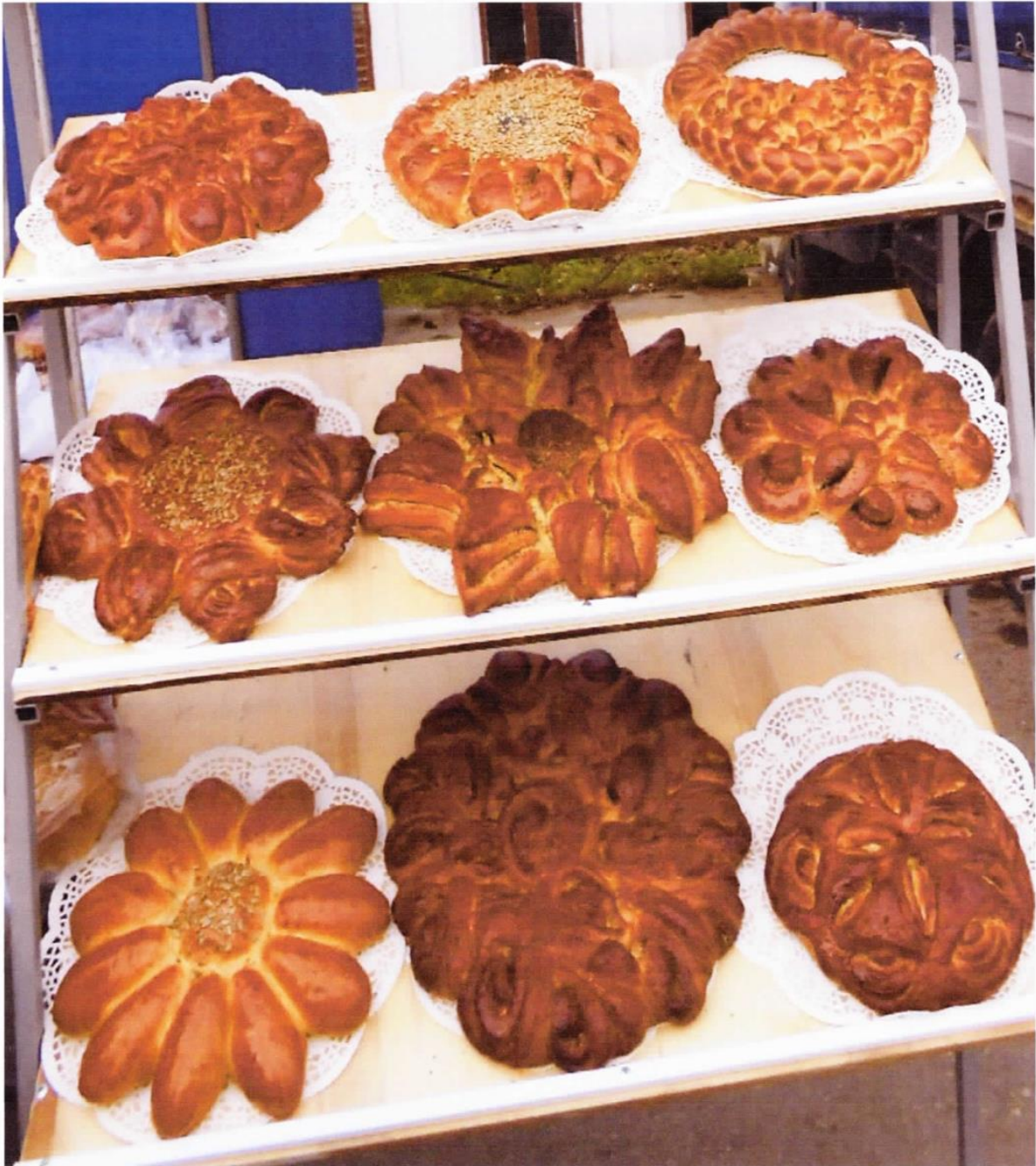
Продукция ООО «Хлебсервис»