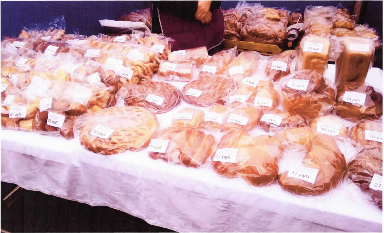
Продукция ООО «Хлебсервис»