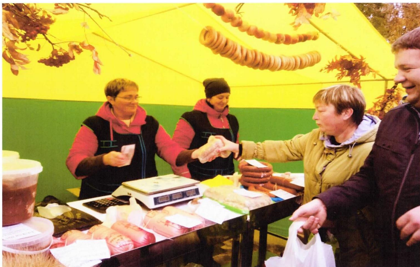
Торговый ярмарочный ряд ООО «Спасский мясопродукт»