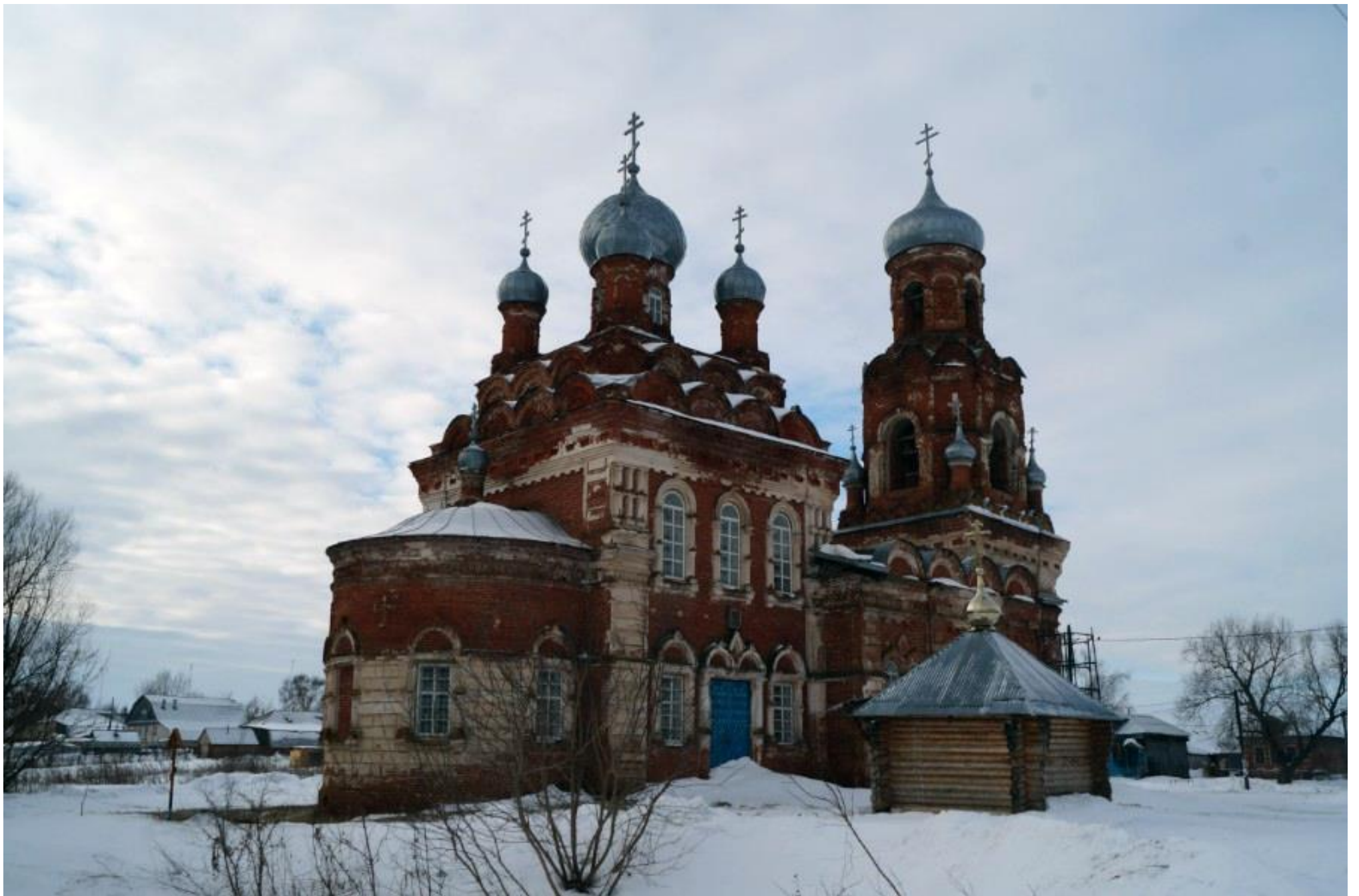
Храм село Вазьянка