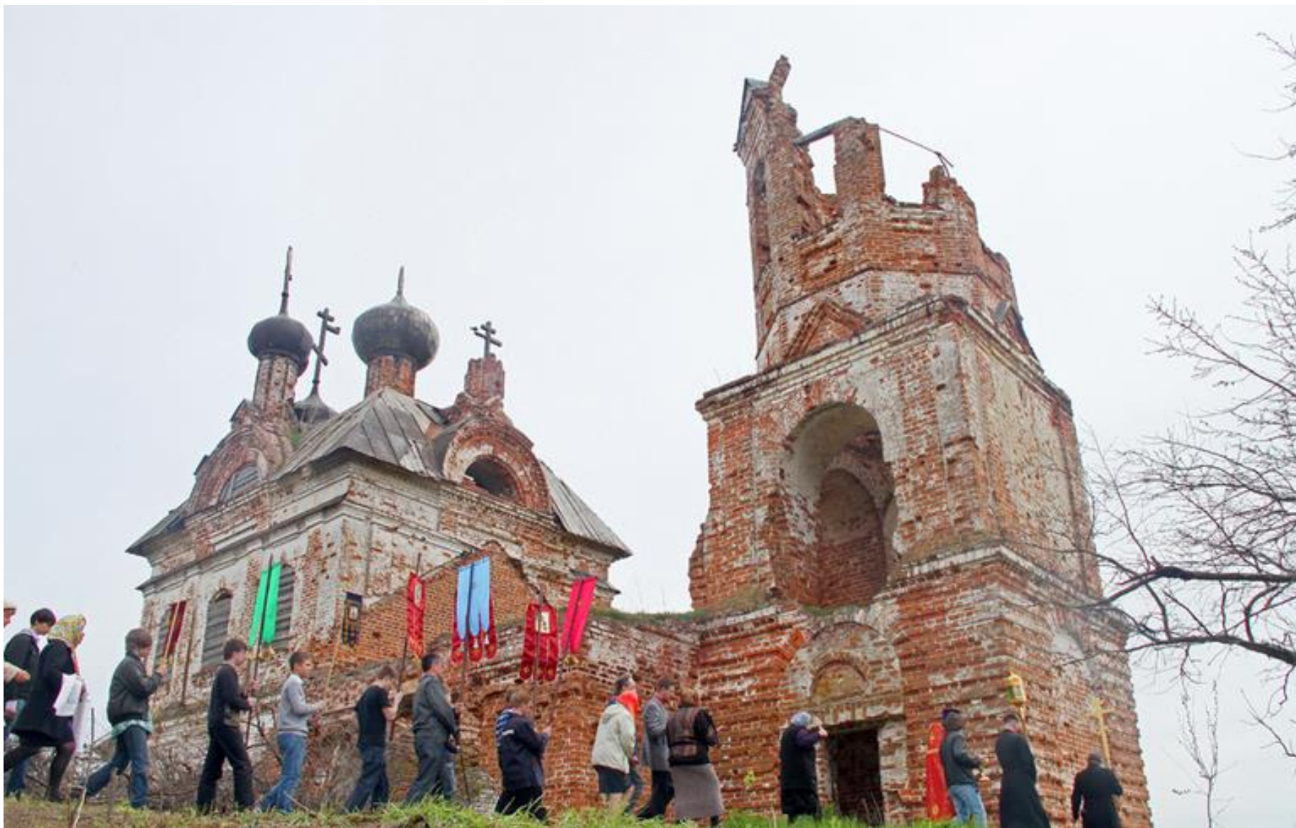
Церковь Иоанна Предтечи село Прудищи Крестный ход