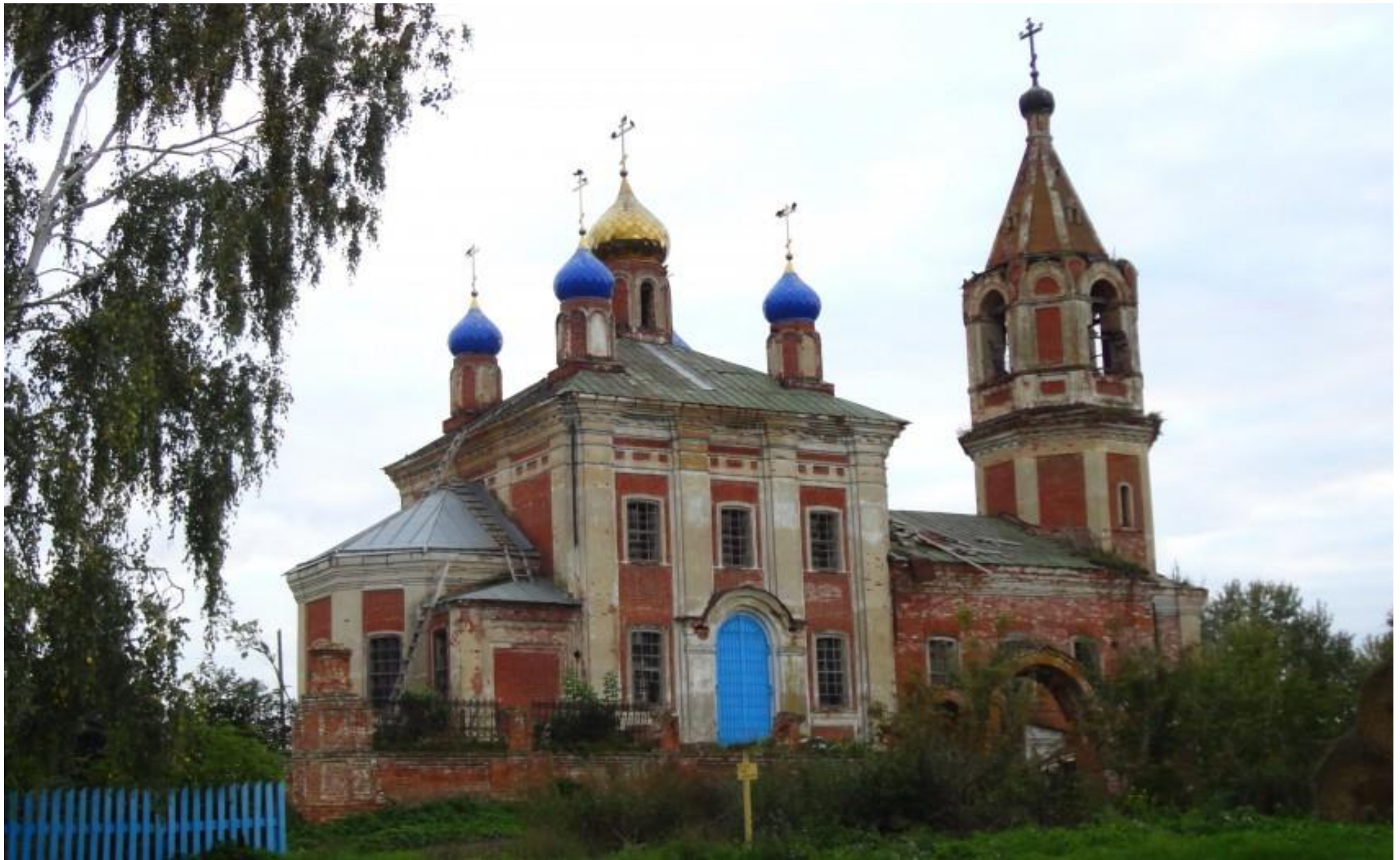
Церковь Вознесения Господня, село Тубанаевка