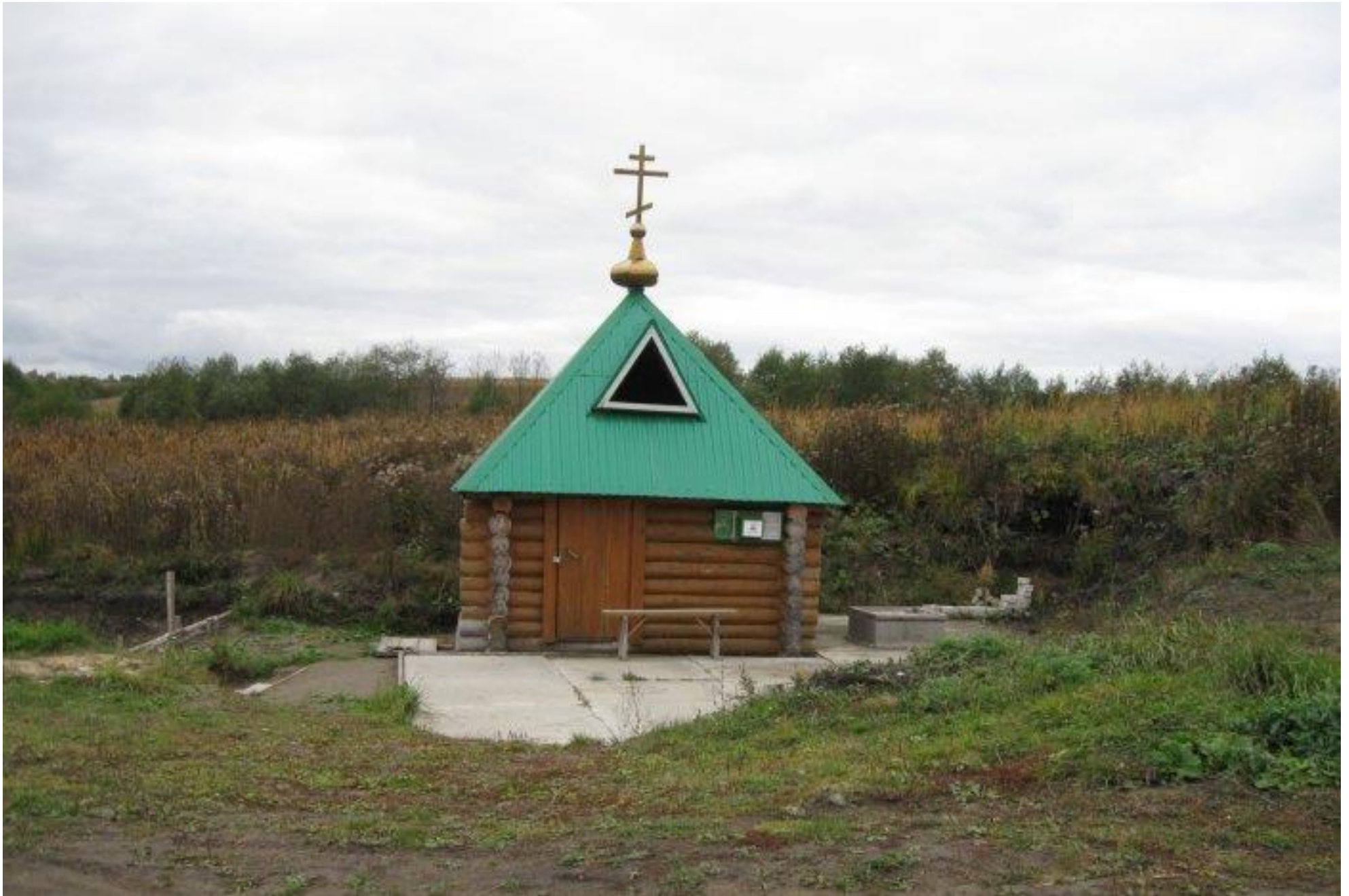
Святой родник Параскевы Пятницы