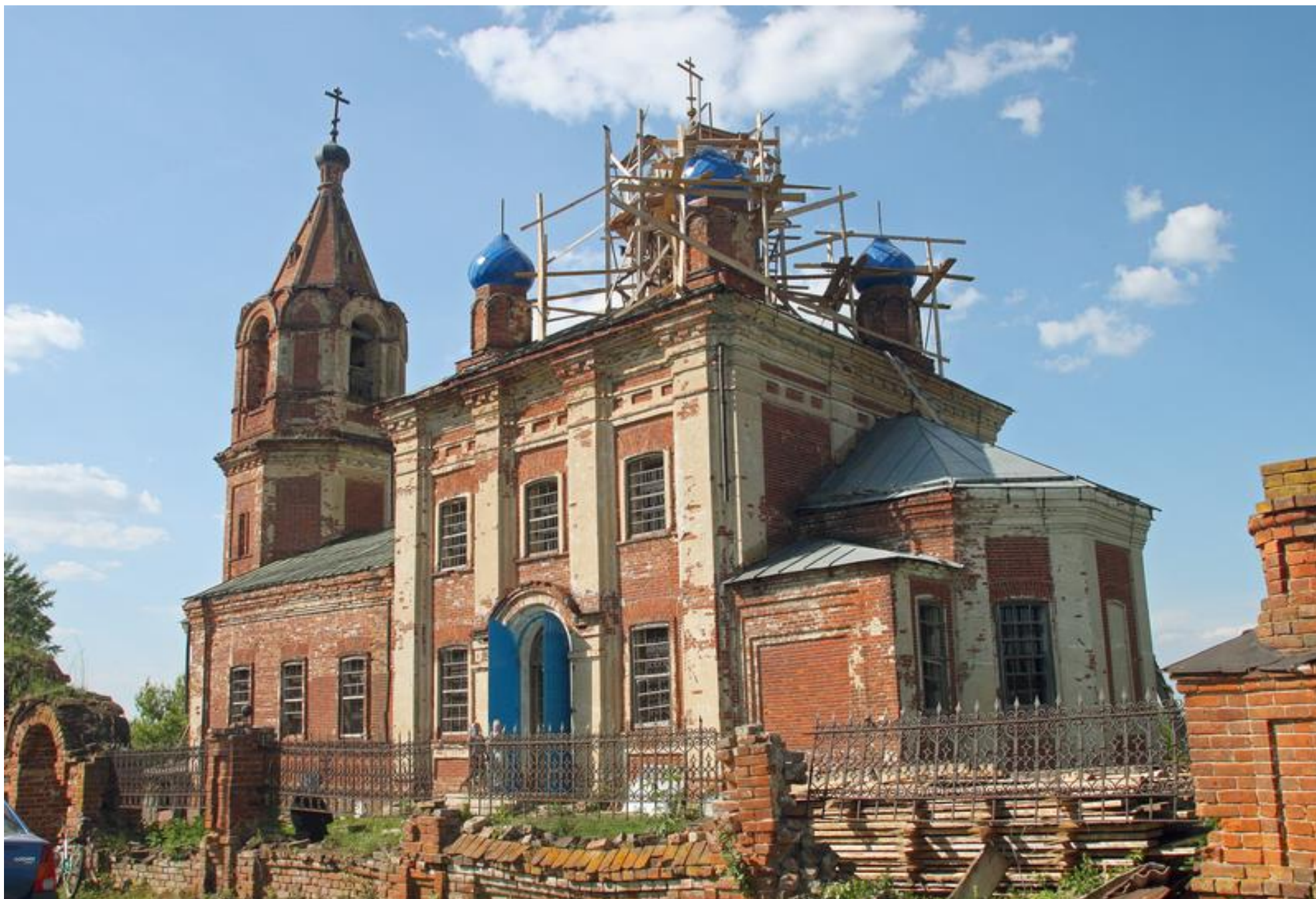
Церковь Вознесения Господня, село Тубанаевка