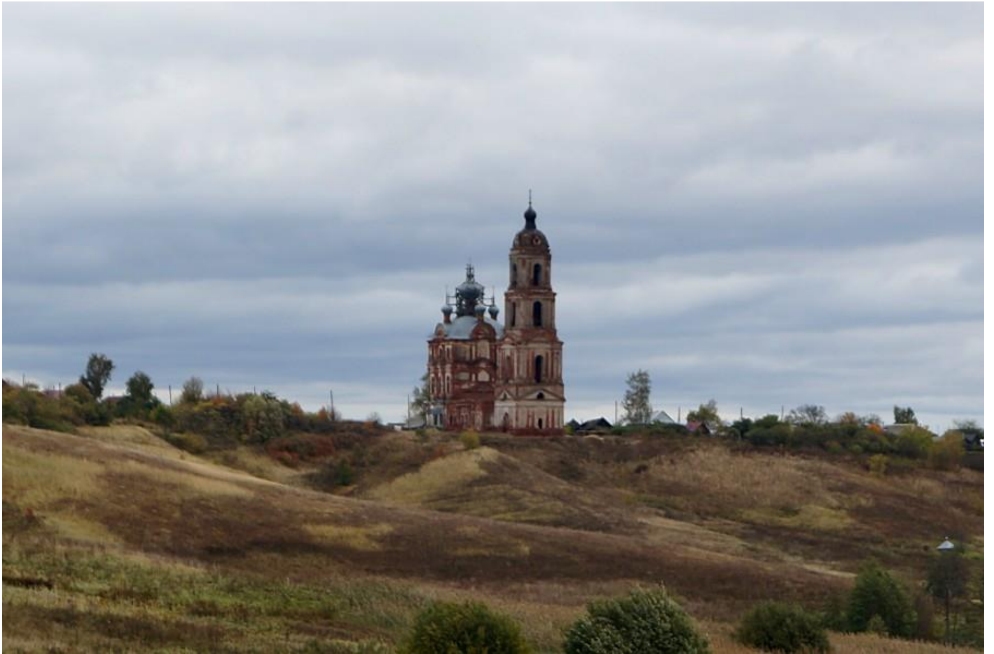
Церковь во имя Михаила Архангела село Низовка