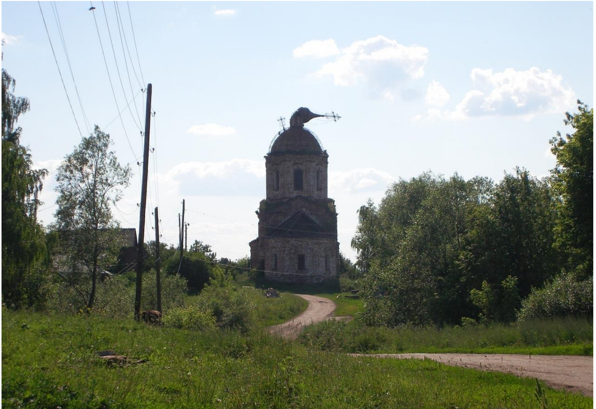
Спасо - Преображенская церковь в селе Масловка