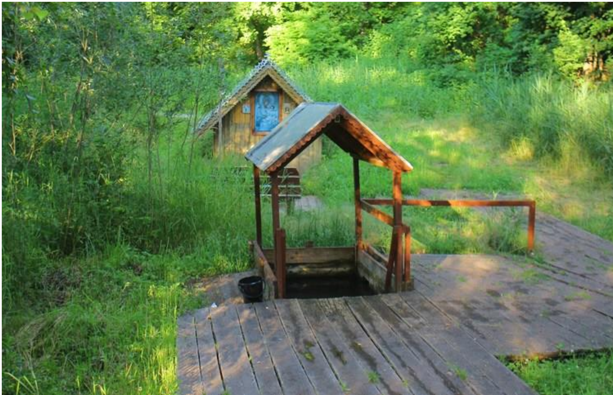
Источник «Булач» село Красные Мары