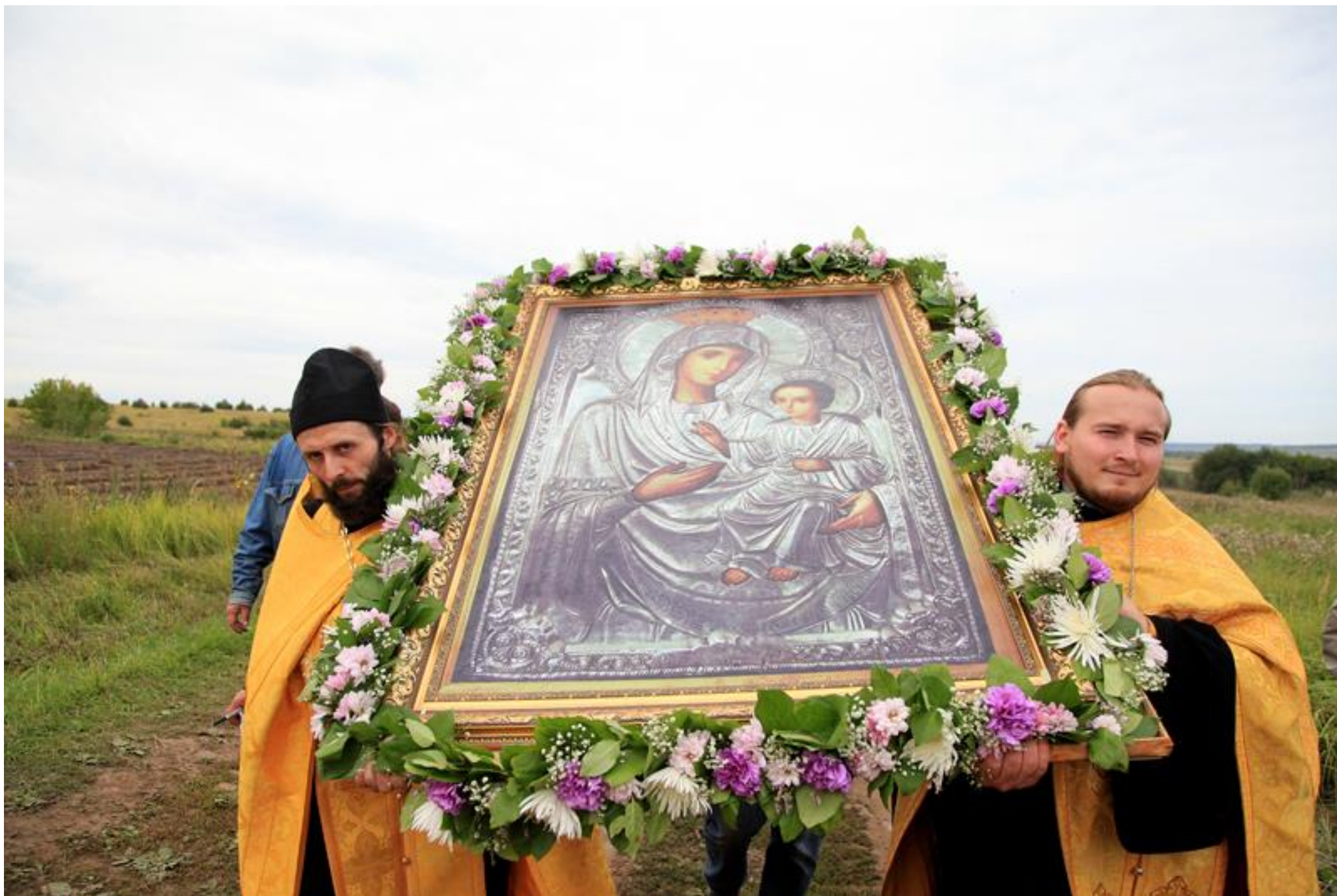
Крестный ход с Иконой Избавительница из села Вазьянка в Красномаровская обитель