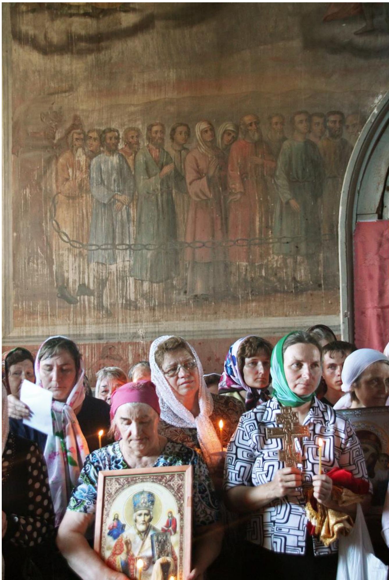
Старинные фрески в храме села Тубанаевка.