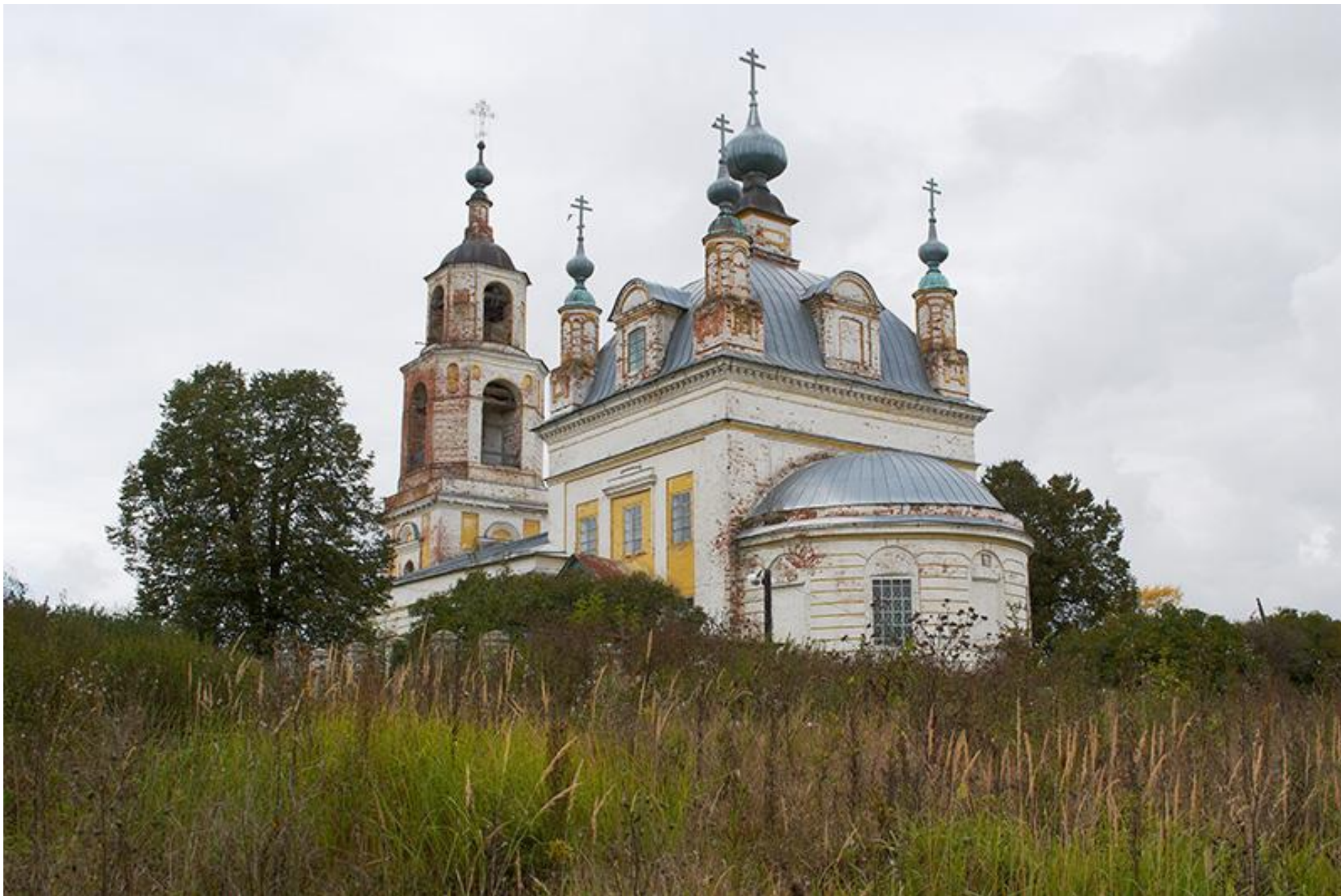
Церковь Рождества Христова село Красный Ватрас