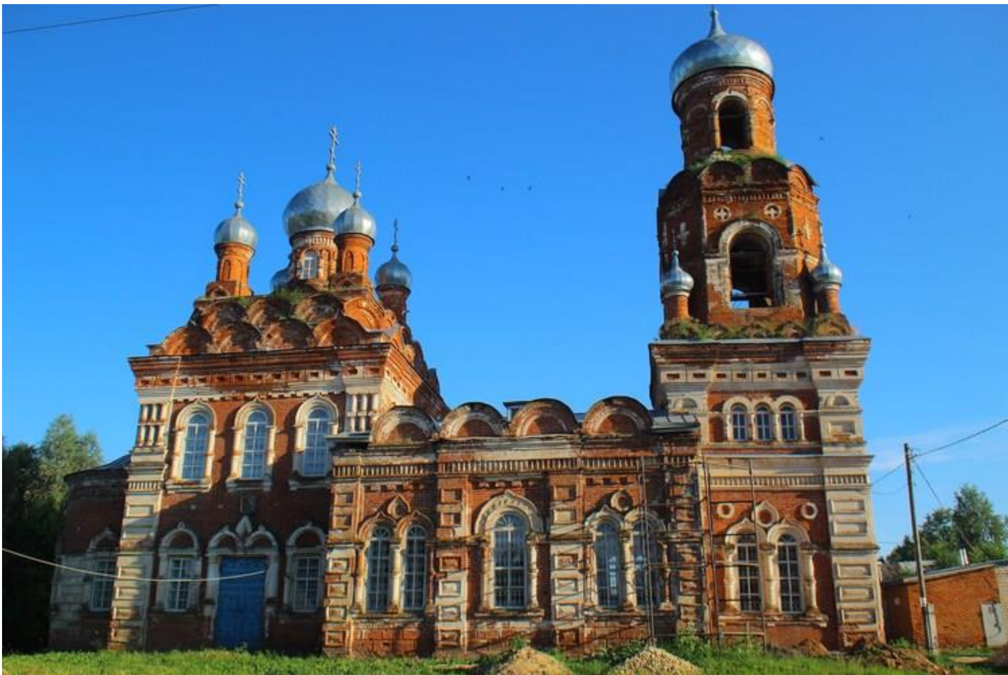
Церковь Иконы Божия Матерь Владимирская Село Вазьянка