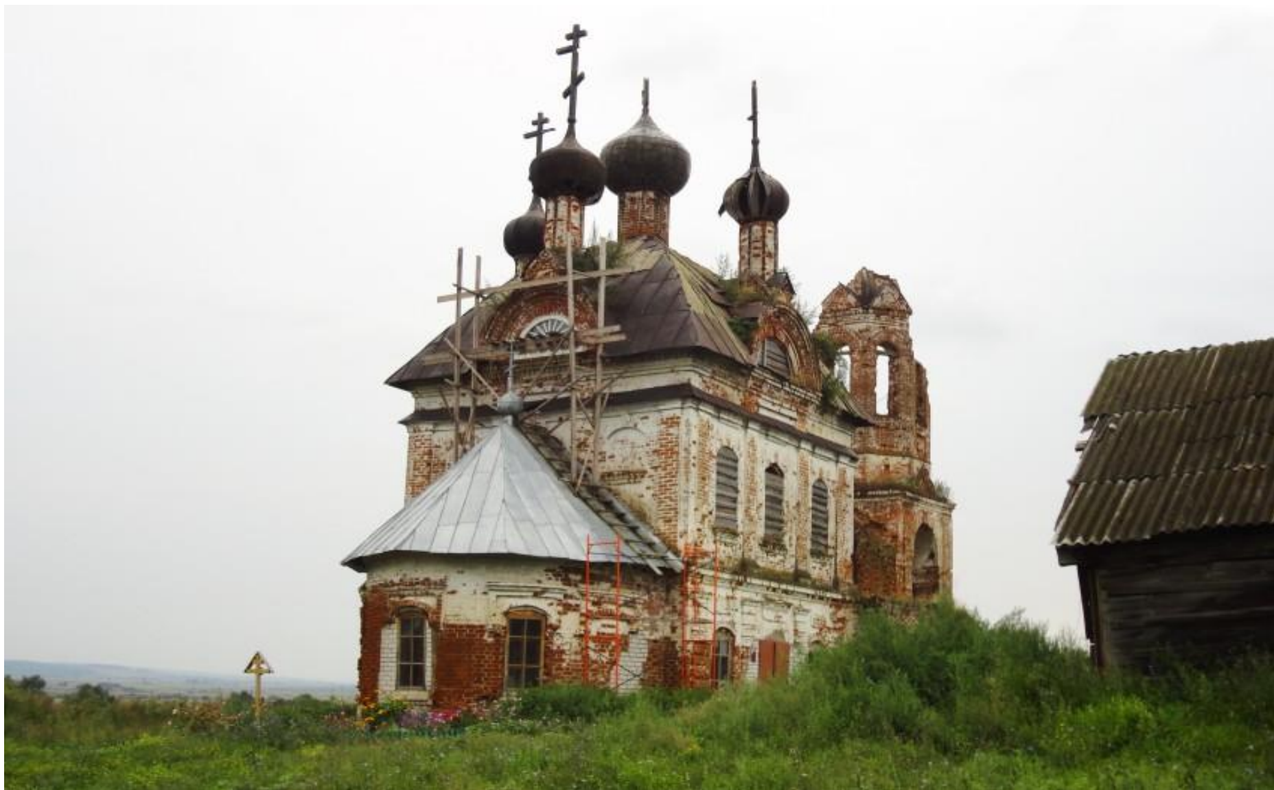
Церковь Иоанна Предтечи село Прудитси