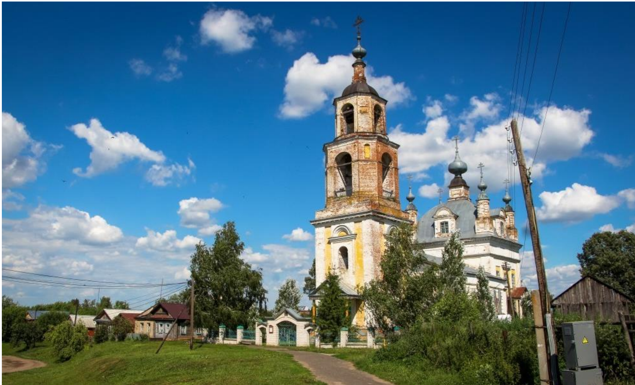
Церковь Рождества Христова село Красный Ватрас