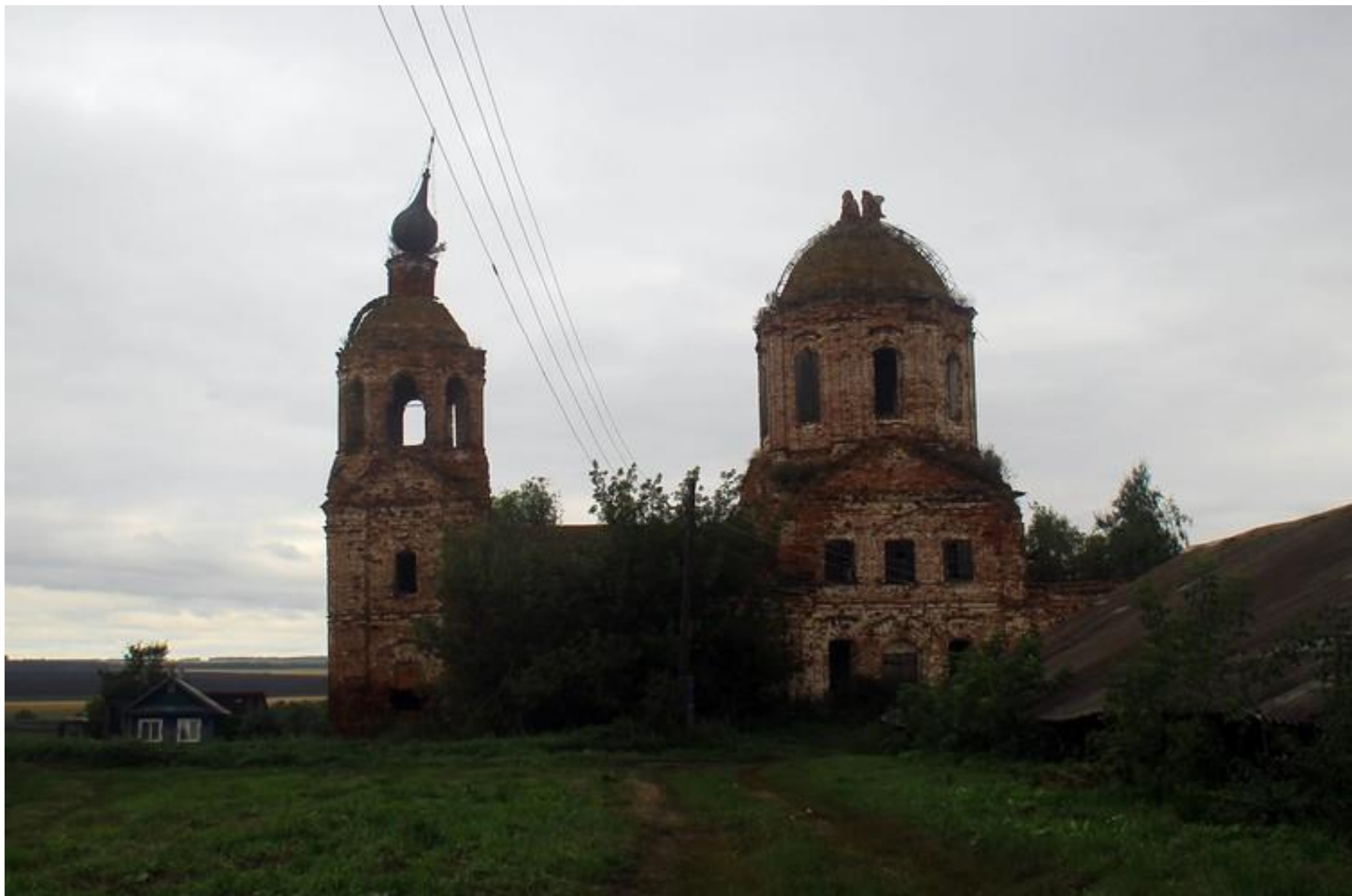
Село Масловка Спасский район