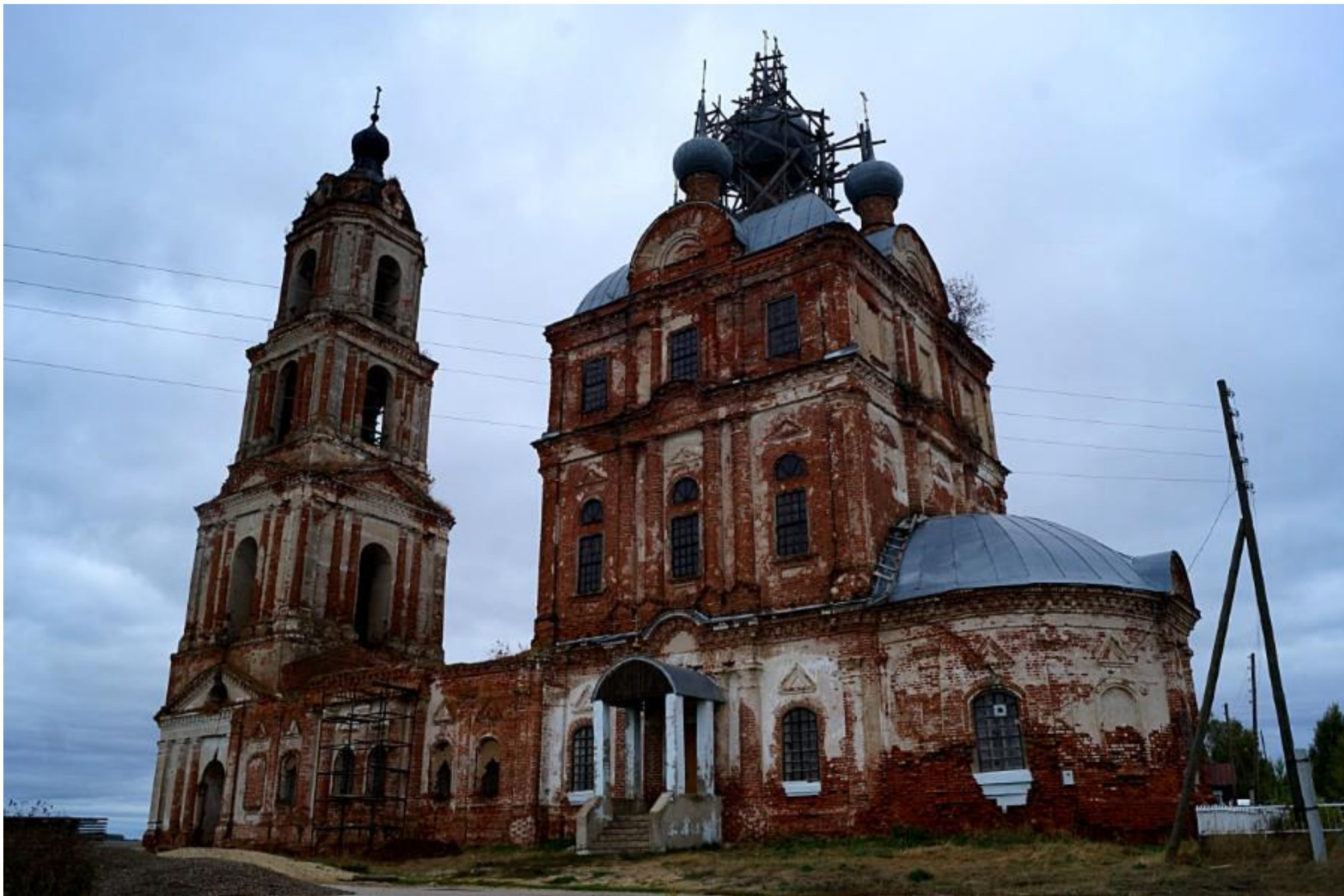
Церковь во имя Михаила Архангела село Низовка