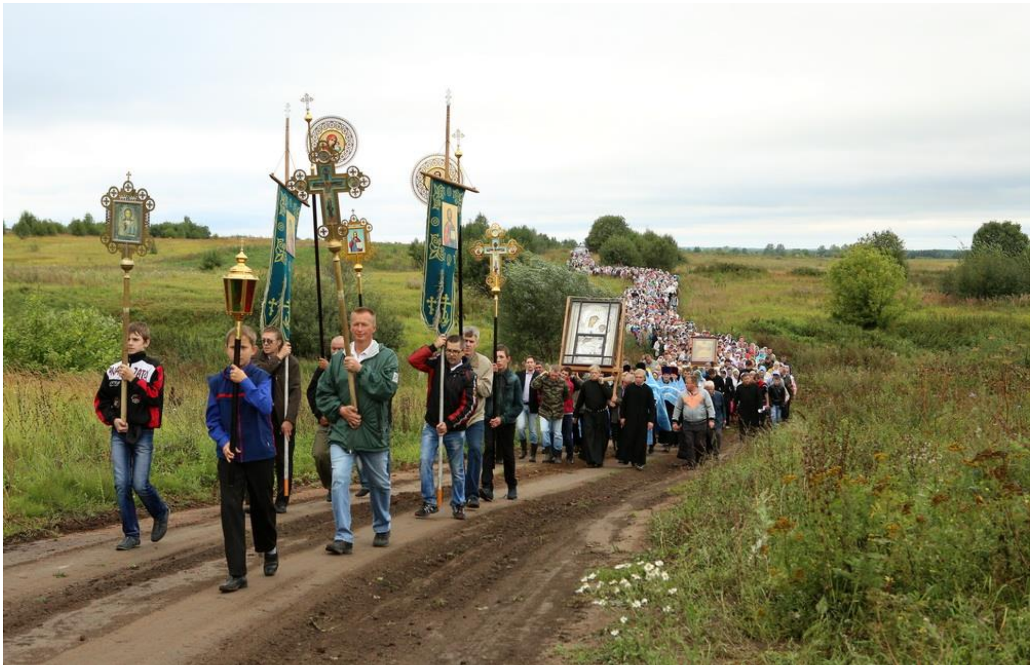
Крестный ход с Иконой Избавительница из села Вазьянка в Красномаровскую обитель