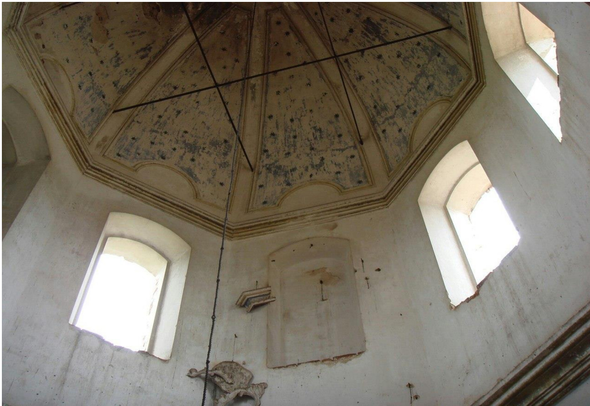
Спасо - Преображенская церковь в селе Масловка